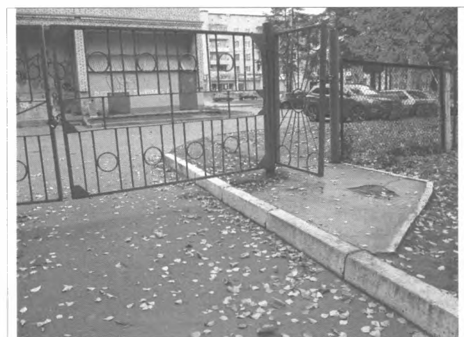
Фото №5 – Прилегающая территория