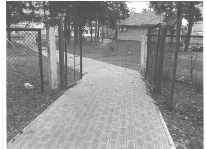
Фото №8 – Вход на прилегающую территорию