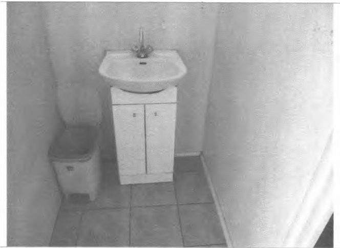
Фото №32 – Санитарно-гигиеническое помещение (раковина)