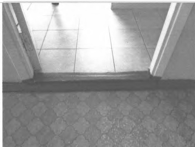
Фото №21 – Пути движения внутри здания (двери)