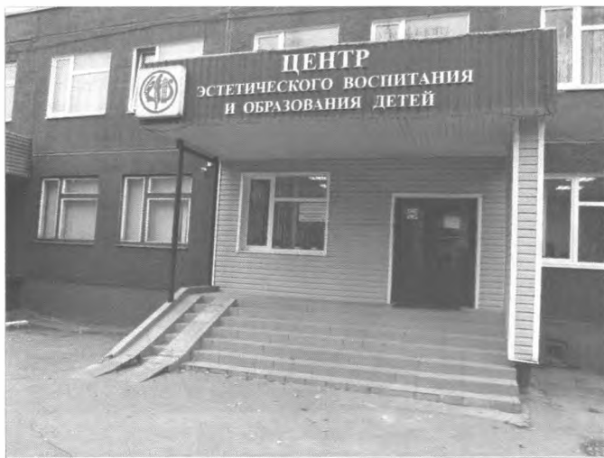
Фото №9 – Главный вход