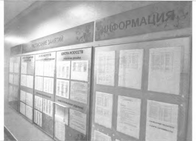
Фото №34 – Система информации