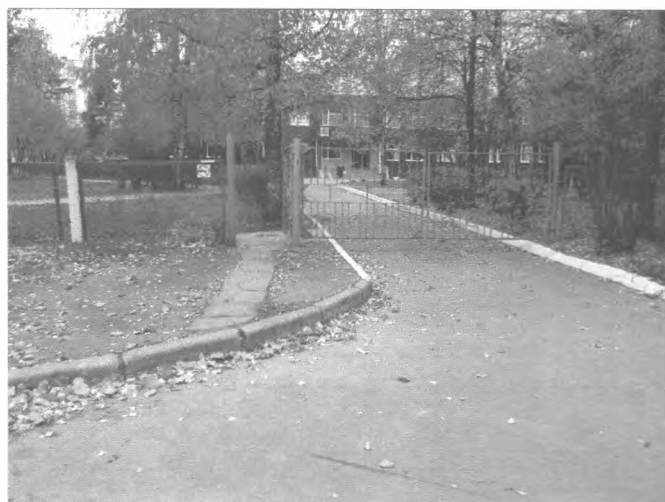
Фото №2 – Подходы к объекту