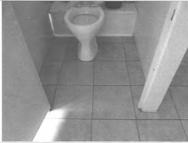
Фото №31 – Санитарно-гигиеническое помещение (туалетная кабина)