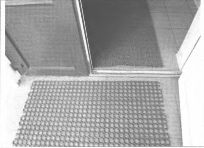
Фото №13 – Наружная входная дверь