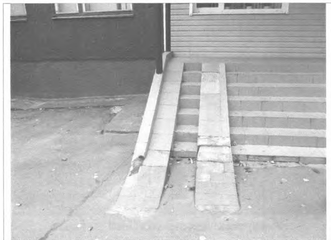
Фото №11 – Пандус