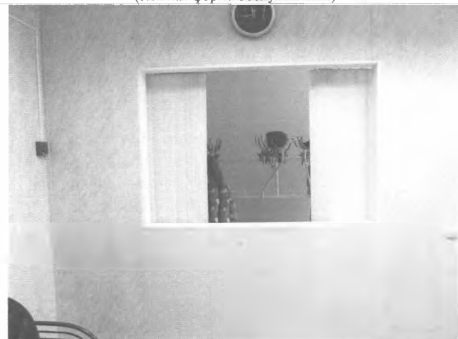
Фото №29 – Гардероб.