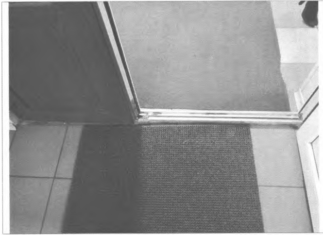
Фото №15 – Внутренняя входная дверь