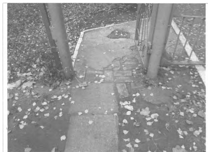
Фото №4 – Вход на прилегающую территорию