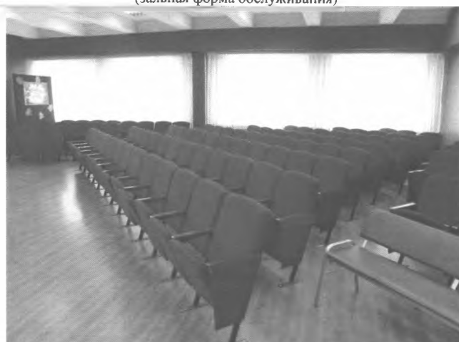
Фото №28 – Зона целевого назначения здания (зальная форма обслуживания)