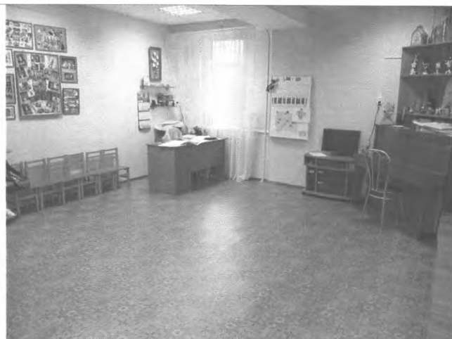
Фото №26 – Зона целевого назначения здания (зальная форма обслуживания)