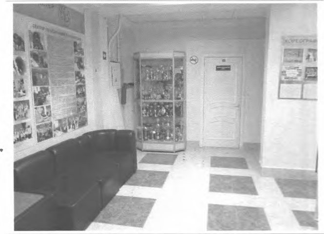
Фото №18 – Пути движения внутри здания (коридор)