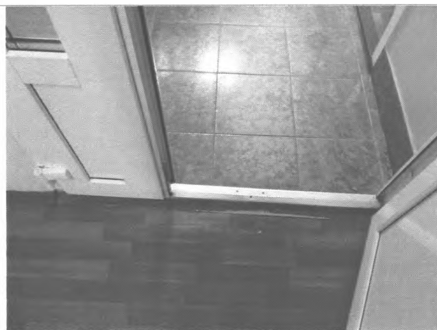
Фото №23 – Пути движения внутри здания (двери)