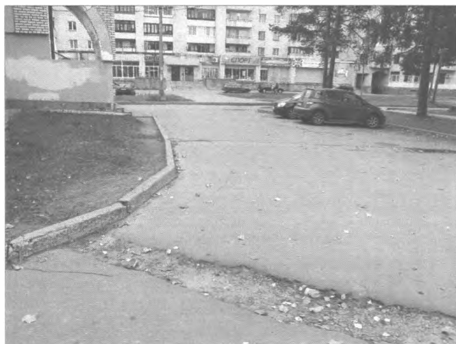
Фото №1 – Подходы к объекту