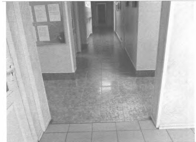
Фото №17 – Пути движения внутри здания (коридор)