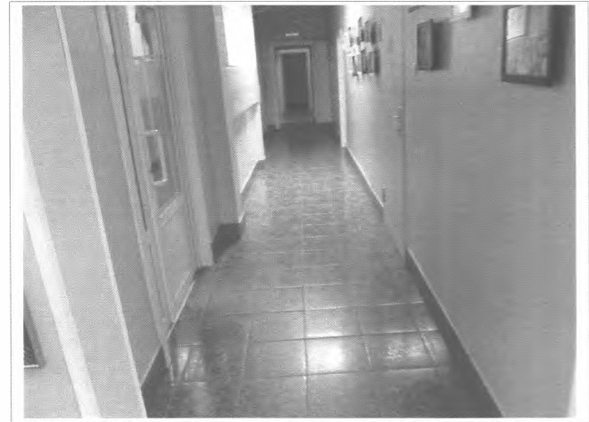
Фото №16 – Пути движения внутри здания (коридор)