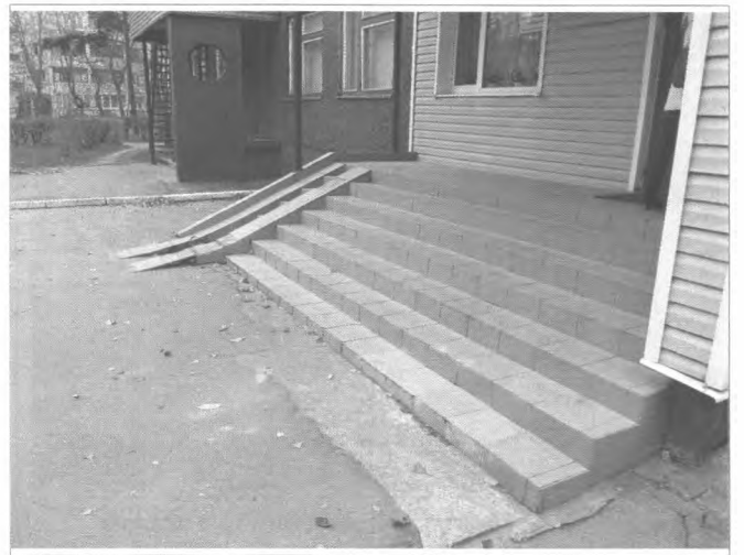
Фото №10 – Наружная лестница