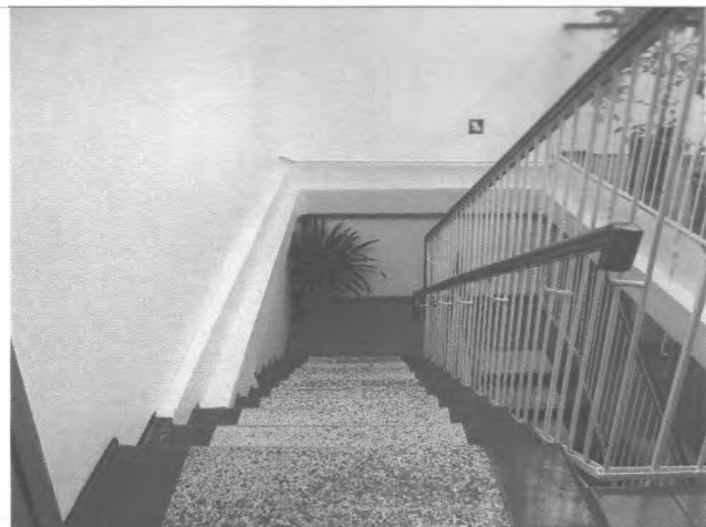
Фото №19 – Пути движения внутри здания (лестницы)