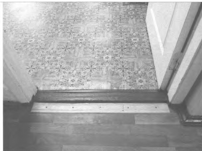
Фото №24 – Пути движения внутри здания (двери)