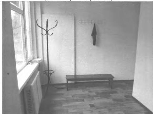
Фото №30 - Гардероб.