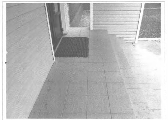
Фото №12 – Входная площадка главного входа