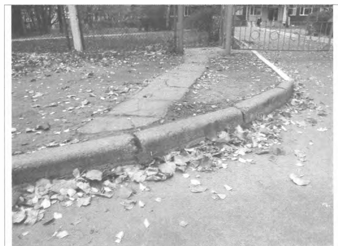
Фото №3 – Подходы к объекту