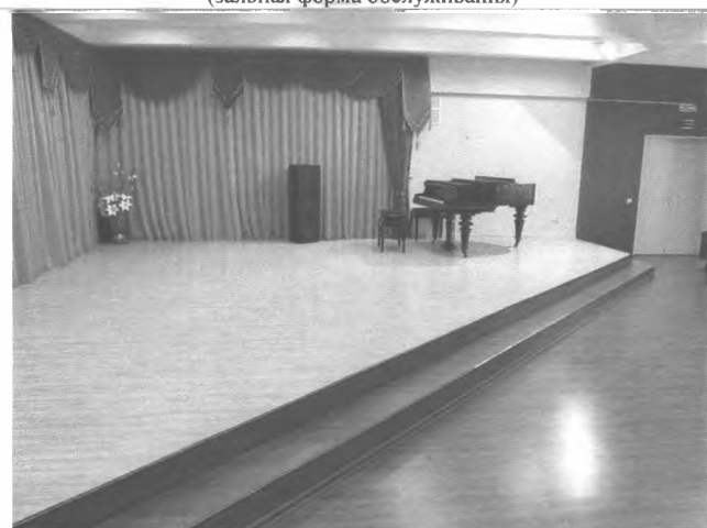
Фото №27 – Зона целевого назначения здания (зальная форма обслуживания)