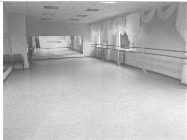
Фото №25 – Зона целевого назначения здания (зальная форма обслуживания)