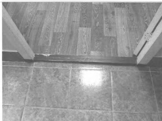
Фото №22 – Пути движения внутри здания (двери)