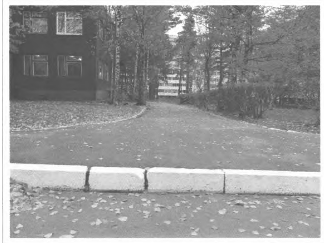
Фото №7 – Прилегающая территория