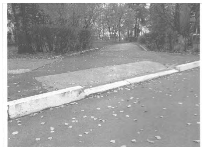
Фото №6 – Прилегающая территория