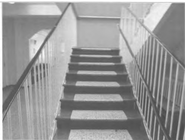
Фото №20 - Пути движения внутри здания (лестницы)